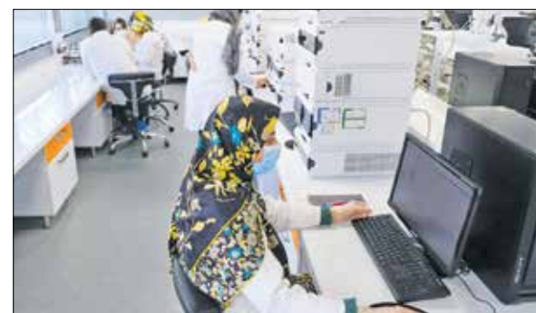
افزایش رشد بهره وری به ۳۰٫۵ درصد در دولت سیزدهم