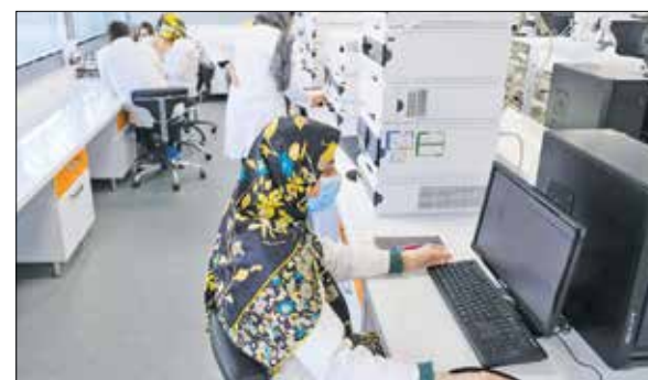
افزایش رشد بهره وری به ۳۰٫۵ درصد در دولت سیزدهم