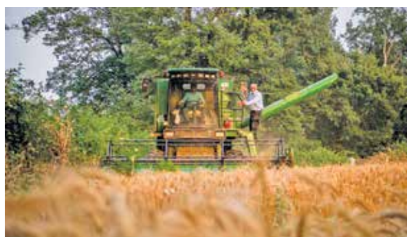
با خرید بیش از ۹ میلیون تن از کشاورزان