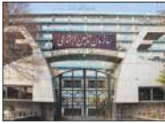
خزانه‌داری کل کشور: