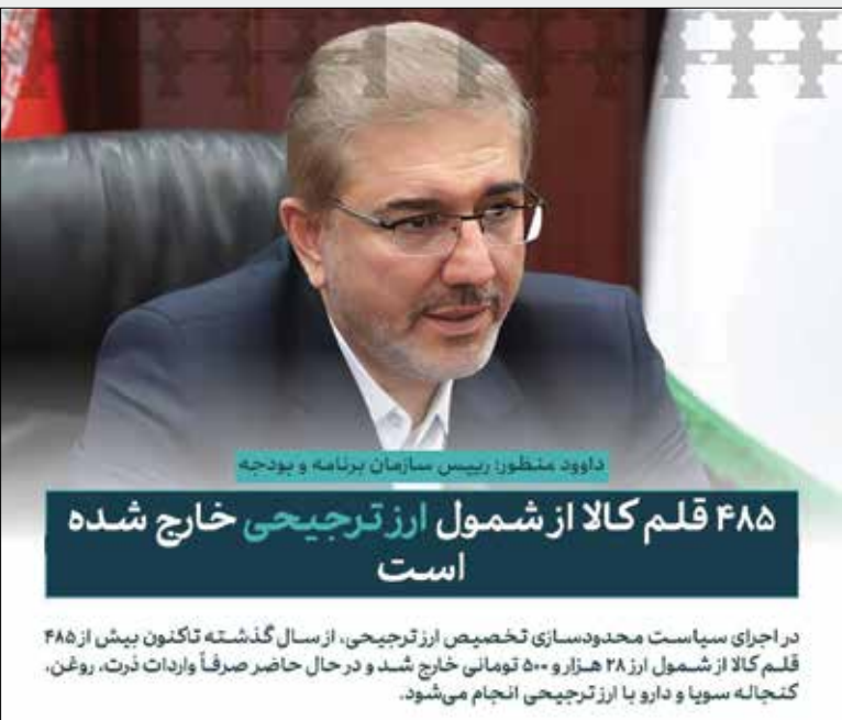
در اجرای سیاست محدودسازی تخصیص ارز ترجیحی، از سال گذشته تاکنون بیش از ۴۸۵ قلم کالا از شمول ارز ۲۸ هزار و ۵۰۰ تومانی خارج شد و در حال حاضر صرفاً واردات ذرت، روغن، کتچاله سویا و دارو با ارز ترجیحی انجام می‌شود.

دولت سیزدهم بر پایدارسازی منابع بودجه عمومی تأکید ویژه‌ای داشت و در مدت سه سال از فعالیت این دولت شاهد رشد درآمدهای مالیاتی و گمرکی هستیم. متوسط رشد درآمدهای مالیاتی و گمرکی در دولت سیزدهم به ۶۱ درصد و نسبت درآمدهای مالیاتی به منابع بودجه عمومی به ۴۱ درصد در سال ۱۴۰۲ رسیده است. مالیات‌های وصولی تا پایان خرداد ماه امسال ۱۹۵ هزار میلیارد تومان بوده است. مودیان می‌توانند با انتخاب خود مالیات‌های پرداختی خود را در حوزه ساخت مدارس، بیمارستان‌ها، اماکن ورزشی و... صرف کنند. به نحوی که مالیات‌دهندگان در عمران و توسعه کشور مشارکت می‌کنند.