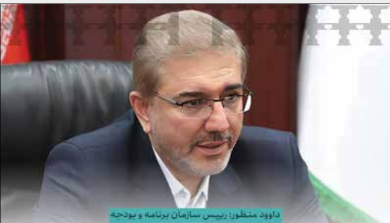
داوود منظور، رئیس سازمان برنامه و بودجه

دولت سیزدهم بر پایدارسازی منابع بودجه عمومی تأکید ویژه‌ای داشت و در مدت سه سال از فعالیت این دولت شاهد رشد درآمدهای مالیاتی و گمرکی هستیم. متوسط رشد درآمدهای مالیاتی و گمرکی در دولت سیزدهم به ۶۱ درصد و نسبت درآمدهای مالیاتی به منابع بودجه عمومی به ۴۱ درصد در سال ۱۴۰۲ رسیده است. مالیات‌های وصولی تا پایان خرداد ماه امسال ۱۹۵ هزار میلیارد تومان بوده است. مودیان می‌توانند با انتخاب خود مالیات‌های پرداختی خود را در حوزه ساخت مدارس، بیمارستان‌ها، اماکن ورزشی و... صرف کنند، به نحوی که مالیات‌دهندگان در عمران و توسعه کشور مشارکت می‌کنند.