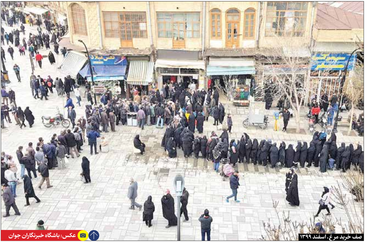
صف خرید مرغ، اسفند ۱۳۹۹