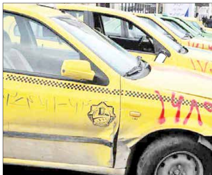
«ایران اقتصادی» از اقدامات دولت سیزدهم برای نوسازی خودروهای فرسوده گزارش می دهد