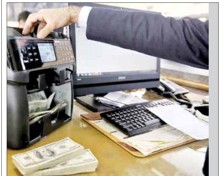
افزایش قابل توجه منابع و درآمدهای ارزی کشور در بهار