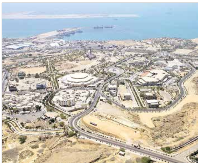
ساخت ۷ سکونتگاه ساحلی جدید در جنوب کشور آغاز شد