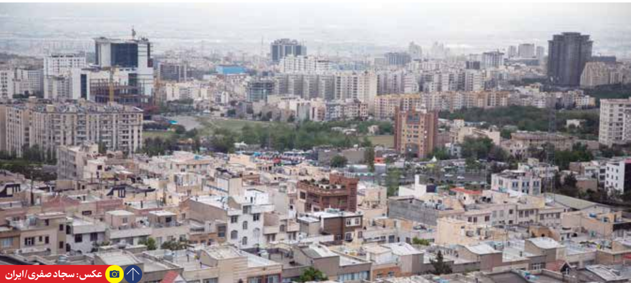
رکورد کمترین تورم نقطه به نقطه مسکن در دولت سیزدهم به ثبت رسید

همچنین توسعه اراضی در طرح شهرهای جدید و شهرک‌های مسکونی دولتی به میزان ۶۰ هزار و ۱۹۷ هکتار در قالب تصویب ایجاد شهرهای جدید، الحاق اراضی به محدوده شهرها، صدور پروانه تأسیس و بهره‌برداری شهرک‌های مسکونی شامل صدور پروانه تأسیس ۳ شهرک، پروانه بهره‌برداری یک شهرک و ۱۳ پروانه مدیریت زمین ۱۳ شهرک مسکونی دولتی انجام شده است.