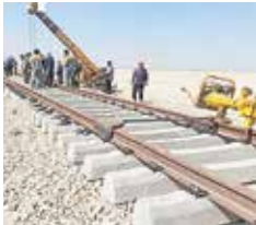
وزیرراه و شهرسازی خیرداد