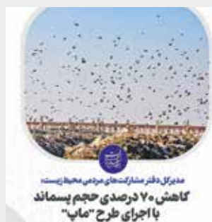
مدیرکل دفتر مشارکت‌های مردمی سازمان حفاظت محیط زیست: کاهش ۷۰ درصدی حجم پسماند با اجرای طرح «ماب»

مدیرکل دفتر مشارکت‌های مردمی و مسئولیت‌های اجتماعی سازمان حفاظت محیط زیست در رابطه با طرح «ماب» اظهار کرد: با اجرای این طرح پس از یک سال پسماندی که جمع‌آوری می‌شود، ۷۰ درصد از نظر حجمی و ۷۰ درصد هم از نظر وزنی کاهش پیدا کرده است.