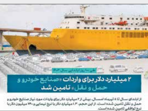
۲ میلیارد دلار برای واردات و صنایع خودرو و حمل و نقل، تأمین شد