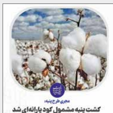
مجری طرح پنبه: کشت پنبه مشمول کود یارانه‌ای شد

مجری طرح پنبه کشور: کشاورزان با مراجعه به مراکز خدمات حمایتی کشاورزی، کود یارانه‌ای برای کاشت در اختیارشان قرار می‌گیرد و حتی برای مرحله داشت نیز کود اوره یارانه‌ای دریافت خواهند کرد.