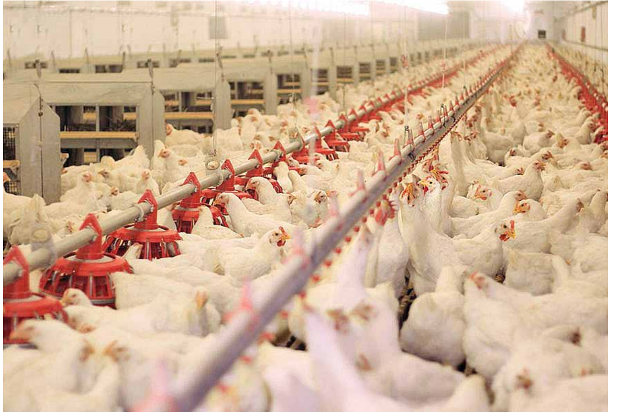
فرا رفتن جوجه‌ریزی خرداد از ۱۵۱ میلیون قطعه