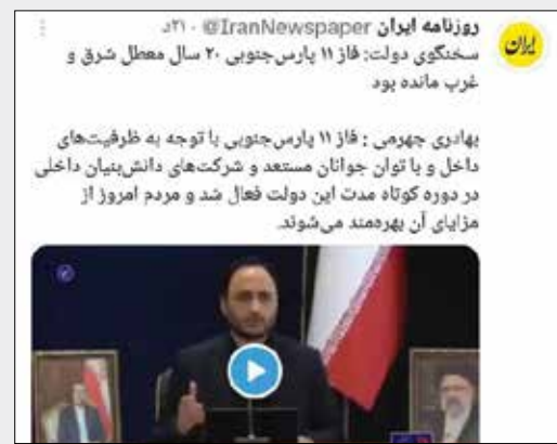
روزنامه ایران IranNewspaper ۲۰ سال معطل شرق و غرب مانده بود

سایت روزنامه ایران با انتشار پستی در فضای مجازی، به نقل از بهادری جهرمی سخنگوی دولت سیزدهم، نوشت: فاز ۱۱ پارس جنوبی با توجه به ظرفیت‌های داخل و با توان جوانان مستعد و شرکت‌های دانش‌بنیان داخلی در دوره کوتاه مدت این دولت فعال شد و مردم امروز از مزایای آن بهره‌مند می‌شوند.