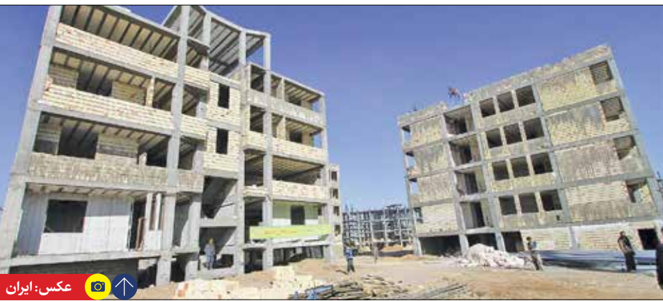
راستا هفته گذشته در شهرهای جدید پزند، هشتگرد، ایوانکی و سهند، واگذاری زمین انجام شده است و در شهرهای جدید