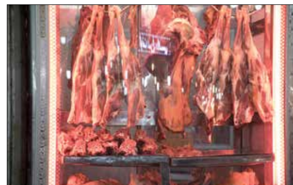
بهبود وضعیت تولید دام در سال ۱۴۰۳