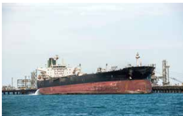
صادرات نفت کشور اکنون نسبت به آغاز فعالیت دولت سیزدهم ۳ برابر شده است

در سال ۱۴۰۲، رشد بخش مسکن در تمام فصل‌ها محسوس است و در فصل آخر سال گذشته رشد بخش مسکن عدد ۱۷ درصد را نشان می‌دهد که بالاترین عدد رشد در سال‌های اخیر و حتی در یک دهه گذشته است