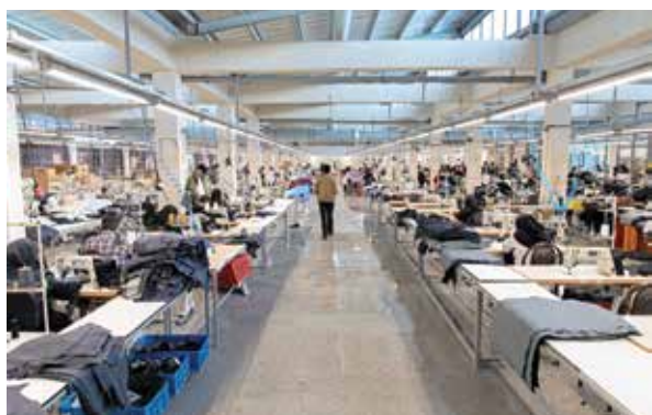
رکوردزنی جدید به لحاظ تعداد جمعیت بیکار