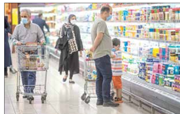
کارشناس اقتصادی در گفت‌وگو با «ایران اقتصادی» مطرح کرد