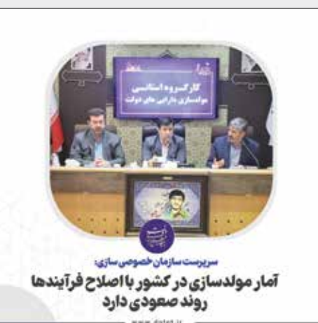
سرپرست سازمان خصوصی‌سازی آمار مولدسازی در کشور با اصلاح فرآیندها روند صعودی دارد