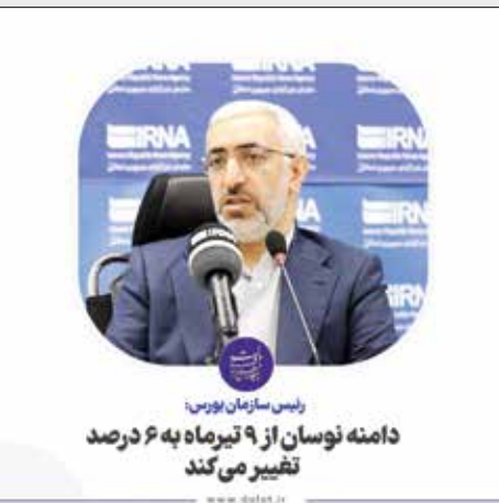
رئیس سازمان بورس دامنه نوسان از ۹ تیرماه به ۶ درصد تغییر می‌کند

هفته‌نامه تازه‌های اقتصاد در فضای مجازی نوشت: طبق اعلام بانک مرکزی، پروژه ریال دیجیتال به مرحله عملیاتی رسیده و از تیرماه سال جاری در جزیره کیش اجرایی می‌شود.