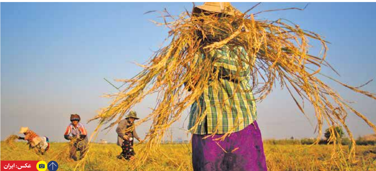
سهم ۸۰ درصدی بیمه‌شدگان روستایی در دولت سیزدهم

وزیر تعاون، کار و رفاه اجتماعی گفت: یکی از مشکلات دولت سیزدهم در آغاز به کار، عدم تناسب منابع و مصارف صندوق‌های بازنشستگی بود و صندوق‌ها را با ۴۰۰ همت بدهی تحویل گرفتیم، اما با تدبیر شهید جمه‌پور تمام بدهی‌های صندوق‌ها به بانک‌ها پرداخت شد و بیش از ۲۰۰ همت مطالبات معوق صندوق‌ها اخذ شد. به گزارش ایرنا، سید صولت مرتضوی گفت: ناترازی در صندوق‌ها ایجاد شده بود که دولت سیزدهم آنها را با ۴۰۰ همت بدهی تحویل گرفت، اما با تدبیر و تأکید شهید جمه‌پور تمام بدهی‌های بانکی پرداخت شده است و در ۳ سال گذشته بیش از ۲۰۰ همت مطالبات معوق صندوق‌ها اخذ شد. وی تصریح کرد: اگر بنیادست فرایندها را اصلاح کنیم باید به خط‌مشی به کار گرفته شده در صندوق روستاییان و کارگزاران نگاه کنیم. سنگ بنای خوبی در این بخش گذاشته شده است که باید از آن تجربه کسب کرد. اکنون بالغ بر ۶۰ درصد مصارف این صندوق را منابع داخلی پوشش می‌دهد و اطمینان دارم با توانی که در صندوق است این عدد به ۱۰۰ درصد خواهد رسید.