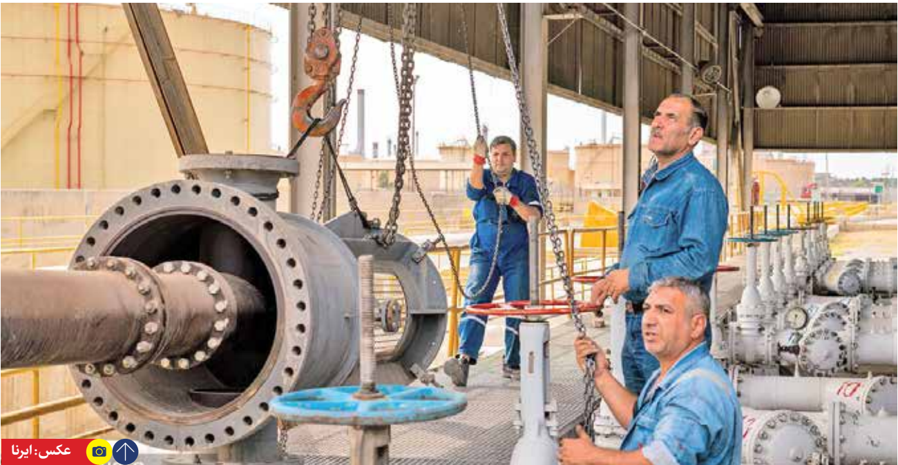
در ۳۳ ماه اخیر منتهی به اول خرداد سال جاری صورت گرفت

براساس یافته‌های آماری گزارش بیست و یکمین دوره طرح شاخص مدیران خرید (PMI) بخش تعاون (اردیبهشت ماه ۱۴۰۳)، «شامخ» کل نسبت به ماه قبل با رقم ۵۲.۲۳ رشد را نشان می‌دهد. شامخ یا همان شاخص مدیران خرید PMI شاخصی شناخته شده در سطح بین‌المللی است که در بیش از ۴۰ کشور دنیا محاسبه و انتشار می‌یابد. هرچه عدد از ۵۰ بالاتر باشد، نشانه رونق و هرچه رقم پایین‌تر از ۵۰ باشد، نشانه رکود و انقباض در آن بخش تلقی می‌شود. به گزارش اتاق تعاون ایران، با استناد به مجموع اظهارات فعالان بخش تعاون در گروه‌های تولیدی و خدماتی مشخص شد که شامخ کل در اردیبهشت ماه ۱۴۰۳ با رقم ۵۲.۲۳ با افزایش چشمگیر در مقایسه با فروردین ماه (۳۹.۵۵)، بیانگر وضعیت رونق اقتصاد تعاون است. عدد شاخص رشته فعالیت‌های صنعتی بخش تعاون در اردیبهشت ماه (۵۶.۷۵) در مقایسه با فروردین ماه (۴۱.۱۳) با افزایشی قابل توجه، در وضعیت رونق اقتصادی قرار گرفته است.