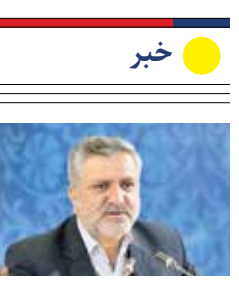
۱۰۰ همت از اموال صندوق های بازنشستگی بازگردانده شد

وزیر تعاون، کار و رفاه اجتماعی گفت: با همکاری قوه قضائیه ۱۰۰ هزار میلیارد تومان از اموال صندوق های بازنشستگی بازگردانده شد. به گزارش ایرنا، سید صولت مرتضوی روز چهارشنبه در حاشیه جلسه هیأت دولت گفت: در حوزه تکافل اجتماعی، مستماری مستمری بگیران تحت پوشش سازمان بهزیستی و کمیته امداد حضرت امام (ره) تقریباً از حیث ریالی در طول این دولت معادل ۱۸۰ درصد افزایش پیدا کرد. وی خاطرنشان کرد: در حوزه توسعه پرداخت حقوق بازنشستگان و بخش قابل توجهی از موقوفات بازنشستگان اقدامات مطلوبی صورت گرفت و همه تلاش ما این است که بحث متناسب سازی و همسان سازی حقوق بازنشستگان راد سازمان تأمین اجتماعی و در سازمان تأمین اجتماعی اجرائی و عملیاتی کنیم. وی ادامه داد: تعداد قابل توجهی از املاک را که برخی اشخاص تصرف کرده بودند با احکام قضایی بازگشت شدند. تاکنون توانسته ایم بالغ بر ۱۰۰ هزار میلیارد تومان حکم به نفع صندوق های بازنشستگی بگیریم.