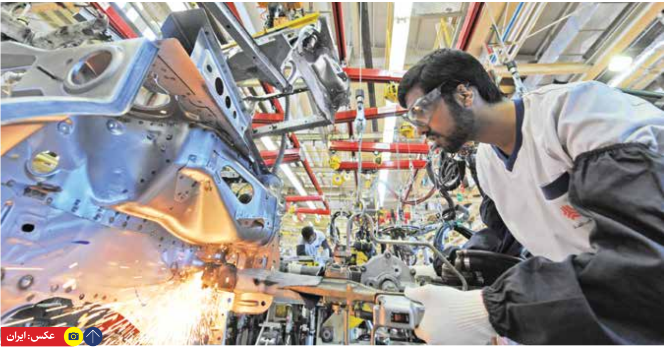
برای نخستین بار، لایحه امنیت شغلی کارگران در دولت سیزدهم به تصویب رسید

وزیر تعاون، کار و رفاه اجتماعی گفت: با همکاری قوه قضائیه ۱۰۰ هزار میلیارد تومان از اموال صندوق های بازنشستگی بازگردانده شد. به گزارش ایرنا، سید صولت مرتضوی روز چهارشنبه در حاشیه جلسه هیأت دولت گفت: در حوزه تکافل اجتماعی، مستماری مستمری بگیران تحت پوشش سازمان بهزیستی و کمیته امداد حضرت امام (ره) تقریباً از حیث ریالی در طول این دولت معادل ۱۸۰ درصد افزایش پیدا کرد. وی خاطرنشان کرد: در حوزه توسعه پرداخت حقوق بازنشستگان و بخش قابل توجهی از موقوفات بازنشستگان اقدامات مطلوبی صورت گرفت و همه تلاش ما این است که بحث متناسب سازی و همسان سازی حقوق بازنشستگان راد سازمان تأمین اجتماعی و در سازمان تأمین اجتماعی اجرائی و عملیاتی کنیم. وی ادامه داد: تعداد قابل توجهی از املاک را که برخی اشخاص تصرف کرده بودند با احکام قضایی بازگشت شدند. تاکنون توانسته ایم بالغ بر ۱۰۰ هزار میلیارد تومان حکم به نفع صندوق های بازنشستگی بگیریم.