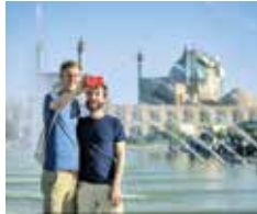
سازمان ملل از آمار ۳ ماهه ۲۰۲۴ خبر داد