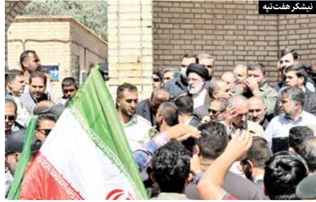
صنایع چوب و کاغذ مازندران