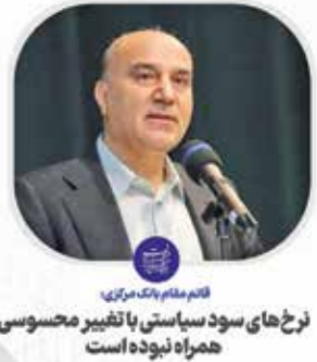
قائم مقام بانک مرکزی نرخ‌های سود سیاستی با تغییر محسوسی همراه نبوده است

سود فعالیت واقعی به دارندگان گواهی سپرده خاص پرداخت می‌شود. کل میزان گواهی سپرده حدود ۲۰۰ همت بوده که تمام آن به فروش رسیده است. ۷۹.۵ همت از این میزان نیز صرف پروژه‌های پیش‌ران شده که به تولید کمک می‌کند.