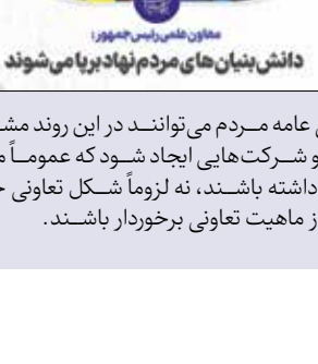
معاون علمی رئیس‌جمهور دانش بنیان‌های مردم‌نهاد برپا می‌شوند

شکلی عامه مردم می‌توانند در این روند مشارکت کنند و شرکت‌هایی ایجاد شود که عموماً ماهیت تعاونی داشته باشند، نه لزوماً شکل تعاونی حقوقی بلکه از ماهیت تعاونی برخوردار باشند.