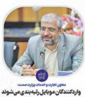
معاون تجارت و خدمات وزارت صمت واردکنندگان موبایل رتبه‌بندی می‌شوند

سود فعالیت واقعی به دارندگان گواهی سپرده خاص پرداخت می‌شود. کل میزان گواهی سپرده حدود ۲۰۰ همت بوده که تمام آن به فروش رسیده است. ۷۹.۵ همت از این میزان نیز صرف پروژه‌های پیش‌ران شده که به تولید کمک می‌کند.