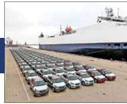
«ایران اقتصادی» از باز شدن قفل ورود خودروهای خارجی در دولت سیزدهم گزارش می‌دهد