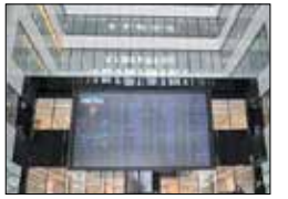
رئیس سازمان برنامه و بودجه در نامه‌ای به شورای نگهبان اعلام کرد