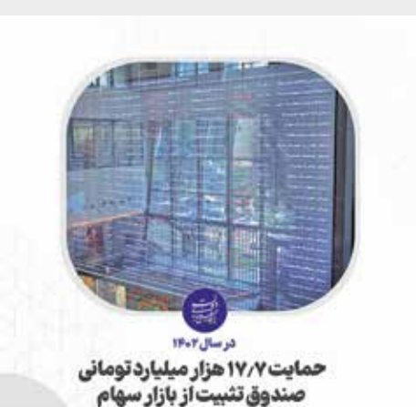
حمایت ۱۷،۷ هزار میلیارد تومانی صندوق تثبیت از بازار سهام

بر اساس گزارش سازمان بورس، ارزش سهام خریداری شده توسط صندوق تثبیت بازار سرمایه در سال ۱۴۰۲ حدود ۱۷ هزار و ۷۰۰ میلیارد تومان است که در فروردین امسال نیز ۲ هزار و ۵۵۰ میلیارد تومان دیگر نیز در راستای حمایت از بازار، سهام خریده است. این گزارش می‌افزاید: در راستای رسالت صندوق تثبیت بازار سرمایه و حمایت از بازار سهام (شرکت‌های بورسی و فرابورسی)، این صندوق در سال گذشته بازار سرمایه و در طی سال‌های اخیر موجودی سهام این صندوق به صورت خرید خرد در همه نمادها و حمایت از بازار سرمایه صرف شده است. طبق این آمار، ارزش سهام خریداری شده توسط صندوق تثبیت بازار سرمایه در سال ۱۴۰۲ رقمی معادل ۱۷ هزار و ۷۰۰ میلیارد تومان بوده است؛ همچنین ارزش سهام فروخته شده به صورت خرد و بلوکی توسط صندوق تثبیت بازار سرمایه در سال ۱۴۰۲ به ترتیب رقمی معادل ۰،۷ همت و ۳،۲ همت بوده است.