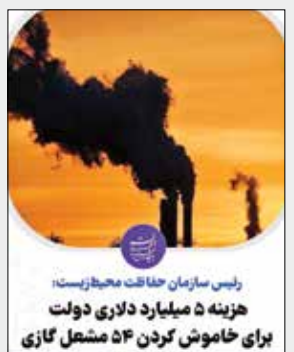
رئیس سازمان حفاظت محیط زیست: هزینه ۵ میلیارد دلاری دولت برای خاموش کردن ۵۴ مشعل گازی

هزینه ۵ میلیارد دلاری دولت برای خاموش کردن ۵۴ مشعل گازی