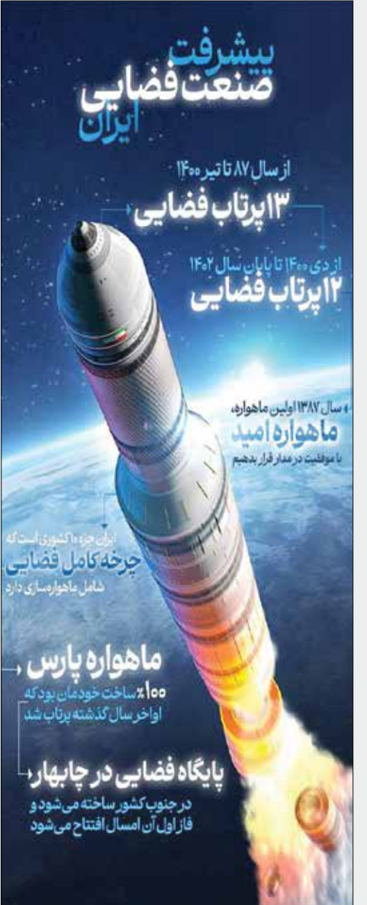
پایگاه فضایی در چابهار، در جنوب کشور ساخته می‌شود و فاز اول آن امسال افتتاح می‌شود

در پست دیگری از پایگاه اطلاع‌رسانی دولت در فضای مجازی درباره پیشرفت صنعت فضایی ایران، آمده است: از سال ۸۷ تا تیرماه سال ۱۴۰۰، ۱۳ پرتاب فضایی صورت گرفت و از دی ماه سال ۱۴۰۰ تا سال ۱۴۰۲ نیز ۱۲ پرتاب دیگر انجام شده است. امروز ایران جزو ۱۰ کشوری در جهان است که چرخه کامل فضایی شامل ماهواره‌سازی را دارد.