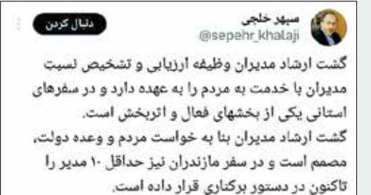
سپهر خلجی @sepehr_khalaji

سپهر خلجی، رئیس شورای اطلاع‌رسانی دولت در فضای مجازی، نوشت: کشت ارشاد مدیران وظیفه ارزیابی و تشخیص نسبت مدیران با خدمت به مردم را به عهده دارد و در سفرهای استانی یکی از بخش‌های فعال و اثربخش است. کشت ارشاد مدیران بنا به درخواست مردم و وعده دولت، مصمم است و در سفر مازندران نیز حداقل ۱۰ مدیر را تاکنون در دستور برکناری قرار داده است.