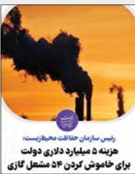
رئیس سازمان حفاظت محیط زیست: هزینه ۵ میلیارد دلاری دولت برای خاموش کردن ۵۴ مشعل گازی

پایگاه اطلاع‌رسانی دولت به نقل از معاون رئیس جمهور و رئیس سازمان حفاظت محیط زیست نوشت: در فضای مجازی، نوشت: رویکرد دولت سیزدهم به سمت کاهش مازوت‌سوزی است که در این زمینه هم از لحاظ زمان و هم حجم مازوت در حال حرکت به جلو و برنامه‌ریزی هستیم. دولت مردمی تنها دولتی است که تا الان نه خاموشی داشته و نه در فصول مختلف سال مردم را لحاظ گرما و سرما با مشکل مواجه شدند، بعضی اوقات حتماً گزینه‌هایی که مورد استفاده قرار می‌گیرد باید به گزینه انتهایی که استفاده از مازوت است برسد و گاهی این اتفاق می‌افتد، زمانی که شورای عالی امنیت ملی موضوعی را تکلیف می‌کند، ما هم از لحاظ قانونی مکلفیم که به آن عمل کنیم اما با توجه به رویکردی که وزارت نفت در زمینه بهینه‌سازی و کفیی‌سازی سوخت دارد، کم‌کم شاهد از سپید خارج شدن سوخت‌های آلاینده خواهیم بود. از وزارت نفت برای ۵ میلیارد دلاری که تاکنون برای خاموش کردن مشعل‌های گازی هزینه کرده تشکر می‌کنیم و امیدواریم این رویکرد بویژه در استان‌های غرب کارون ادامه پیدا کند تا شاهد از بین رفتن مشکلات محیط زیستی ناشی از سوختن مشعل‌های گازی در آن مناطق نباشیم.