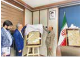
با حضور وزیر فرهنگ و ارشاد اسلامی انجام شد