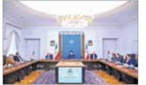
در جلسه شورای عالی هماهنگی اقتصادی سران قوا صورت گرفت