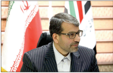
دکتر محمد رضوانی فر معاون وزیر اقتصاد و رئیس کل گمرک ایران

امروز بهره‌گیری از توانمندی‌ها در گمرک جمهوری اسلامی ایران، استفاده از ابزارهای الکترونیکی و کنترلی، اجرای برنامه، پیشبرد سیاست‌ها و اهداف راهبردی در راستای طرح تحول دیجیتال گمرک، با هدف ایجاد تحول و شفافیت، تسهیل‌گری، بهبود شرایط و ارائه خدمات برتر به فعالان اقتصادی و تسهیل فعالیت فعالان حوزه تجارت خارجی، از جمله محوری‌ترین اقدامات و رویکردهای گمرک است که این مهم بدون تلاش موثر همکاران خدوم گمرک، تعامل موثر با خدمت‌گیرندگان و ذینفعان و دستگاه‌های مرتبط در حوزه تجارت خارجی امکان‌پذیر نخواهد بود. در شرایط کنونی با توجه به برنامه‌های تسهیل‌گری گمرک و اهمیت آن و شعار سازمان جهانی گمرک در سال ۲۰۲۴ تحت عنوان «تعامل هدفمند گمرک با شرکای سنتی و جدید»، استمرار و تلاش مضاعف به منظور اجرایی کردن سیاست‌های گمرک در راستای تعامل گمرک با فعالان اقتصادی و همکاری با دستگاه‌های دخیل در امر تجارت خارجی با فضای تقابلی همکار و نشست‌های دو جانبه جهت اجرای برنامه‌های راهبردی برای تسهیل و توسعه تجارت بیش از پیش ضروری است.