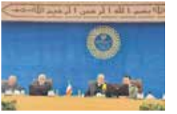
وزیر کشور خطاب به آموزش و پرورش‌ها: