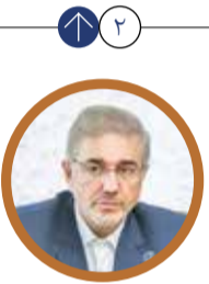
داوود منظور، معاون رئیس جمهور:

سرمایه گذاری هزاران میلیاردی برای رونق تولید واشغال در زنجان