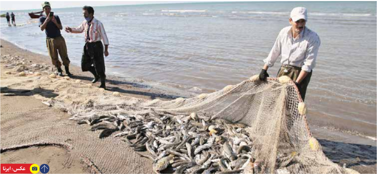
دبیر اتحادیه تولید و تجارت آبزبان ایران خبر داد