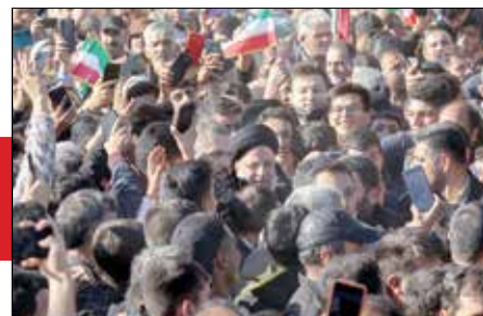
تکمیل طرح‌های نیمه تمام جزو اولویت‌های دولت است