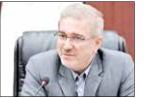
رئیس سازمان برنامه و بودجه: