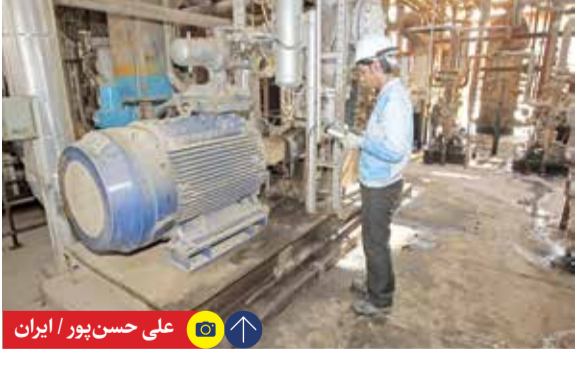
علی حسن پور / ایران

مدیرکل دفتر سیاستگذاری و توسعه اشتغال وزارت تعاون، کار و رفاه اجتماعی که در هشتمین ویژه برنامه هم‌نورد سخن می‌گفت، ادامه داد: در مورد نرخ بیکاری