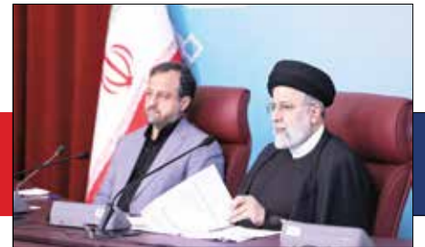
۷ دستور رئیس‌جمهور به مدیران وزارت اقتصاد برای ارتقای عملکرد نظام اقتصادی کشور