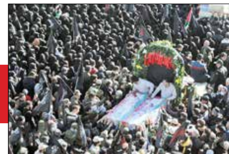
۱۱۰ پیکر شهید گمنام روی دستان مردم تهران تشییع شدند