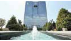
نگاهی به قانون جدید بانک مرکزی