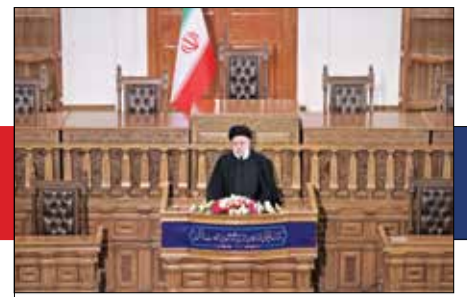
در مقابل تهاجم فرهنگی نباید منفعل بود