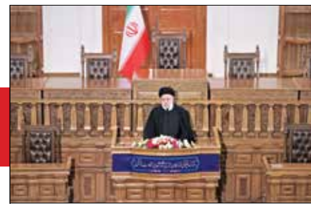
در مقابل تهاجم فرهنگی نباید منفعل بود