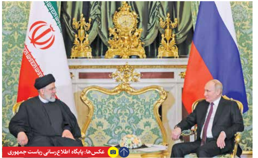
دیدار رؤسای جمهور ایران و روسیه در مسکو