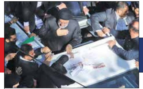
در برخورد با فساد به هیچ کس رحم نخواهم کرد