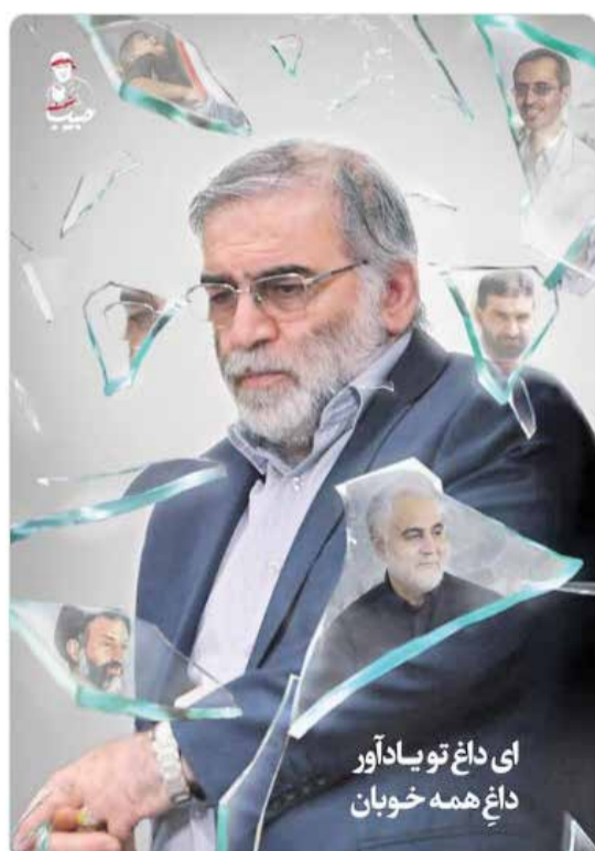
ای داغ تو یادآور داغ همه خوبان

تازنمای خبری خط انرژی در صفحه‌اش در شبکه اجتماعی X نوشت: سعید عقلی، سرپرست دیسپاچینگ گاز اعلام کرد: لاکچری نشینانی داریم که در اوج مصرف و سرما، استخرهای روباز خود را با گاز گرم می‌کنند و در عین حال برای قبض ۵۰ میلیون تومانی خود معترضند.