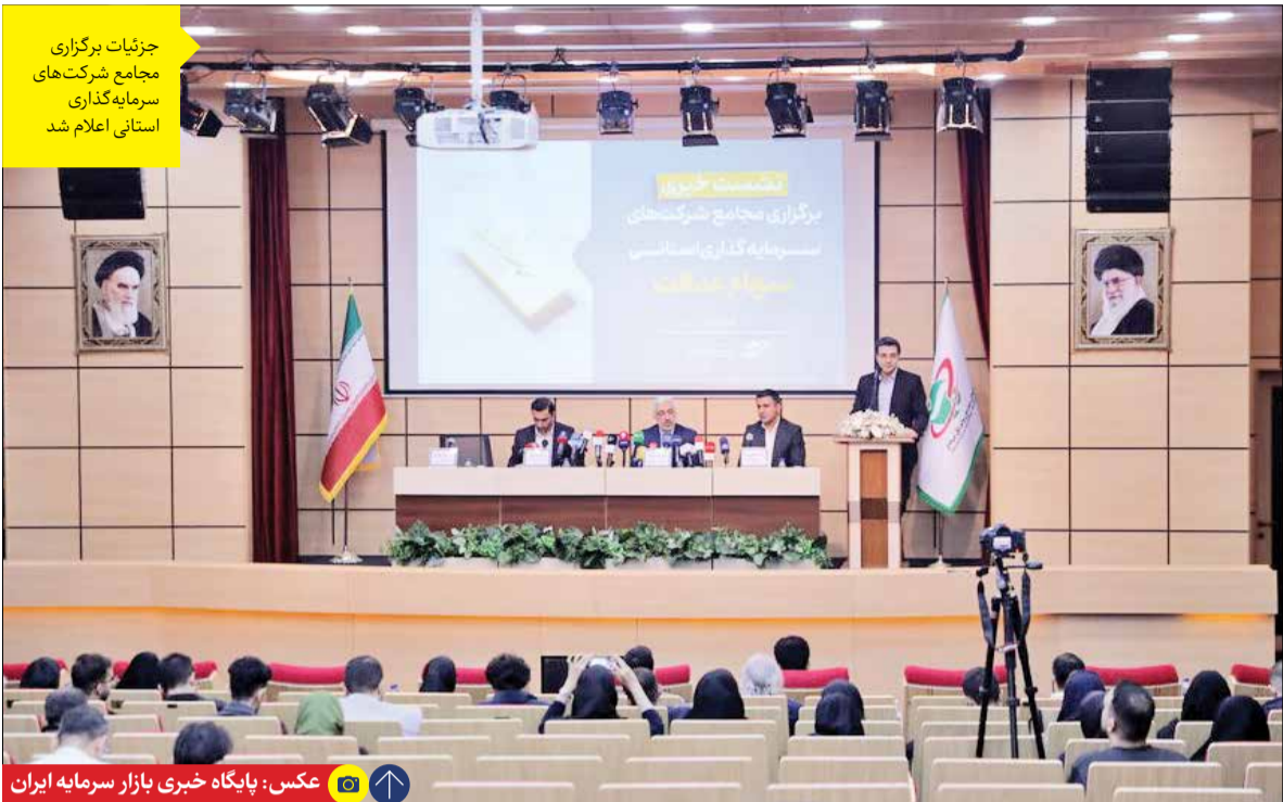
جزئیات برگزاری مجمع شرکت‌های سرمایه‌گذاری استانی اعلام شد

تالارهای بورس کالای ایران دیروز سه شنبه ۷ آذر ماه میزبان عرضه ۴۳۲ هزار و ۶۲۲ تن انواع کالا و محصول بود که بیشترین عرضه‌های دیروز در تالار پتروشیمی و فرآورده‌های نفتی رقم خورد به گوی آن که ۱۰۸ هزار و ۹۸۱ تن مواد پلیمری و پتروشیمی در این تالار روی تابلو رفت. به گزارش کالاخبر، تالار محصولات صنعتی و معدنی نیز میزبان عرضه ۲۳ هزار تن ورق گالوانیزه، ۸ هزار تن ورق سرد، ۴ هزار و ۳۲۰ تن مس مفتول، ۲ هزار و ۵۰۰ تن سیمان پرتلند آهنکی، ۲ هزار تن ورق قلع انندود، ۲۰۰ تن بیلت آلومینیوم، ۳۴۰ تن شمش آلیاژ، ۱۸۰ تن سیم و مفتول مسی و ۱۰۰ تن مفتول آلومینیوم بود. تالار صادراتی شاهد عرضه ۱۱۰ هزار تن گندله سنگ آهن، ۵۰ هزار تن قیر، ۱۰ هزار تن میلگرد و ۷ هزار تن گوگرد گرانوله بود. تالار حراج بازار میزبان عرضه ۸۰ هزار تن وکیوم باتوم و ۲۰۰ تن مس کاند بود. در بازار فرعی ۲ هزار و ۹۶ مترمکعب MDF خام، ۲ هزار عدد بشکه خالی، یک هزار و ۳۰۵ عدد ضایعات صندوق چوبی، ۵۳۰۳ عدد ضایعات مونتاژ خودرو، ۱۵۸۰ عدد ضایعات بشکه پلاستیکی، ۱۲۶ عدد لاستیک ضایعاتی، ۸۰ عدد ضایعات بدنه‌های خودرو، ۲۰ هزار تن کلوخه باربست، ۳ هزار و ۲۱۰ تن ضایعات فولادی، یک هزار و ۴۴۲ تن تیشو، ۳۰۰ تن ضایعات چدن، ۲۵۳ تن ضایعات ورق فولادی، ۸۰ تن لوله مسی، ۵۰ تن ضایعات چوبی و ۴ تن ضایعات آلومینیومی روی تابلو رفت.