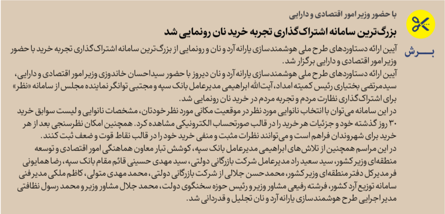
با حضور وزیر امور اقتصادی و دارایی

وزیر امور اقتصادی و دارایی با اشاره به رونمایی سامانه «نظر» اظهار کرد: با رونمایی از این سامانه مردم می‌توانند نظرات خود را درباره نقاط ضعف، نقاط قوت، تخلفات و پیشنهادات در خصوص هوشمندسازی یارانه نان اعلام کنند و امیدواریم بزرگ‌ترین سامانه نظارت مردمی را در هوشمندسازی