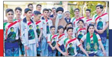
رهبر انقلاب در دیدار مدال آوران بازی‌های آسیایی و پاراآسیایی هانگزو تأکید کردند