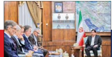
در هفتمین دیدار دکتر مخبر و دستیار ویژه رئیس جمهور روسیه مطرح شد