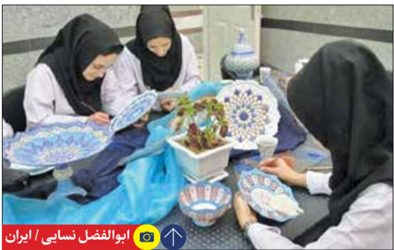
ابوالفضل نسایی / ایران

زودبازده به شمار می‌رود که می‌تواند به رفاه و اقتصاد خانوادگی کمک کند.