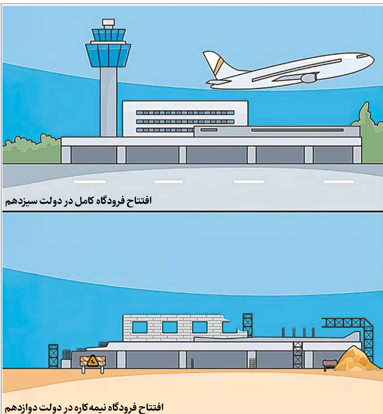
افتتاح فرودگاه کامل در دولت سیزدهم