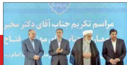
مراسم تکریم جناب آقای دکتر مخبر حاجت‌الاسلام آیت‌الله العظمی آملی امام‌زاده