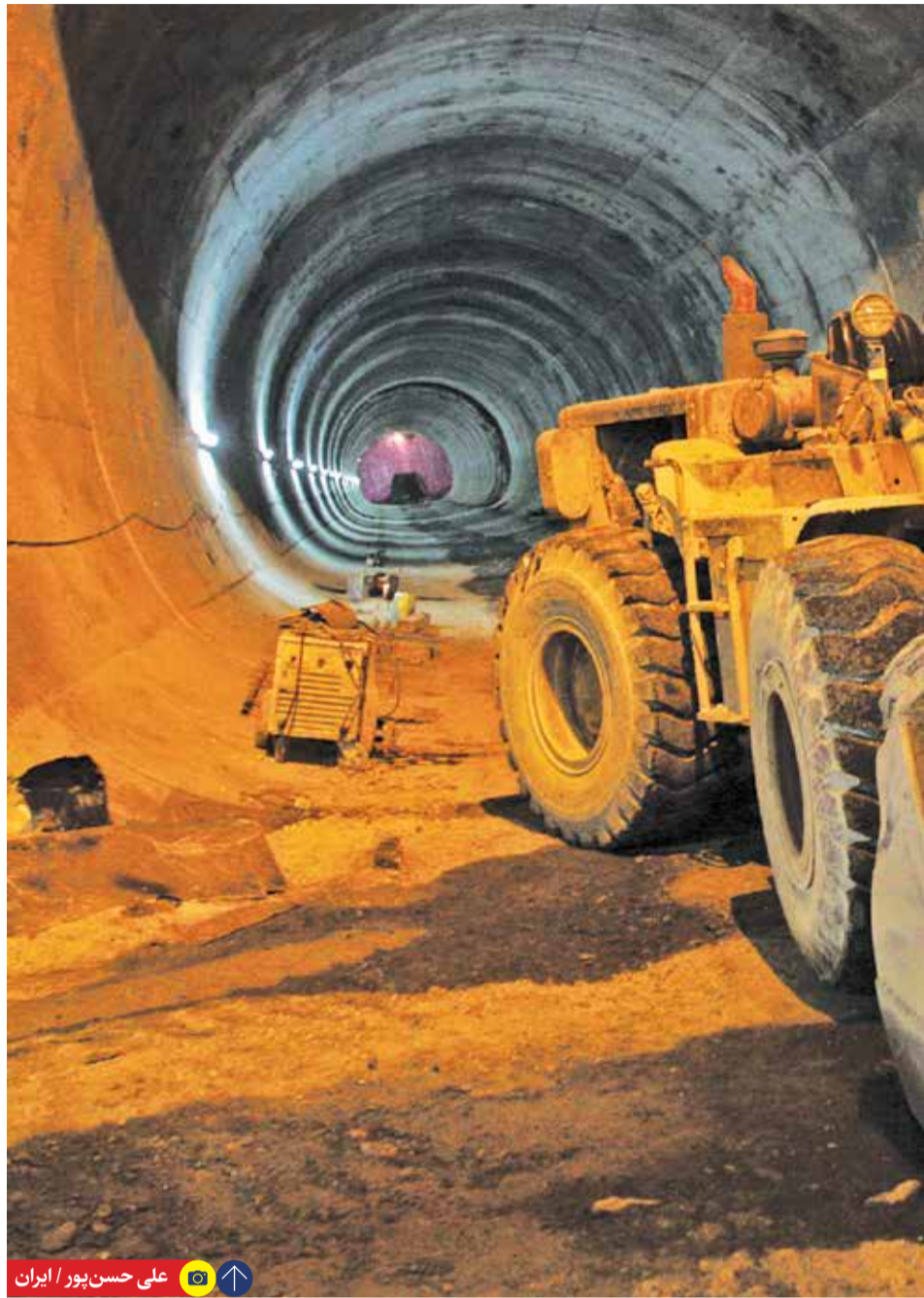
علی حسن پور / ایران