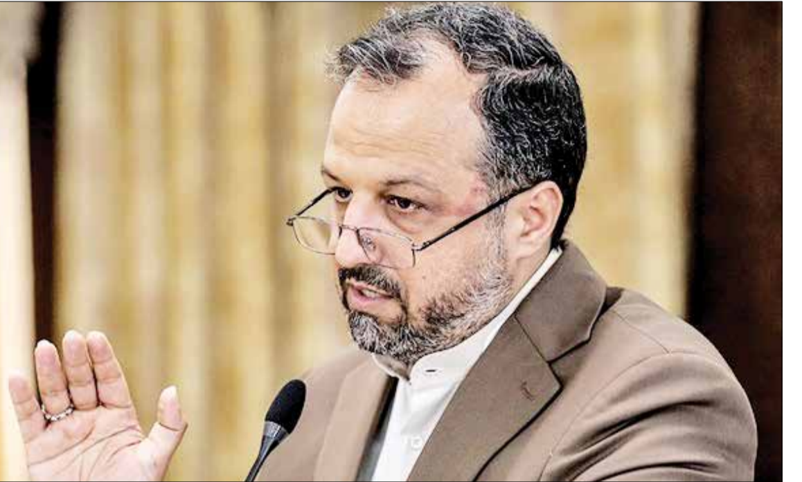
وزیر امور اقتصادی و دارایی: