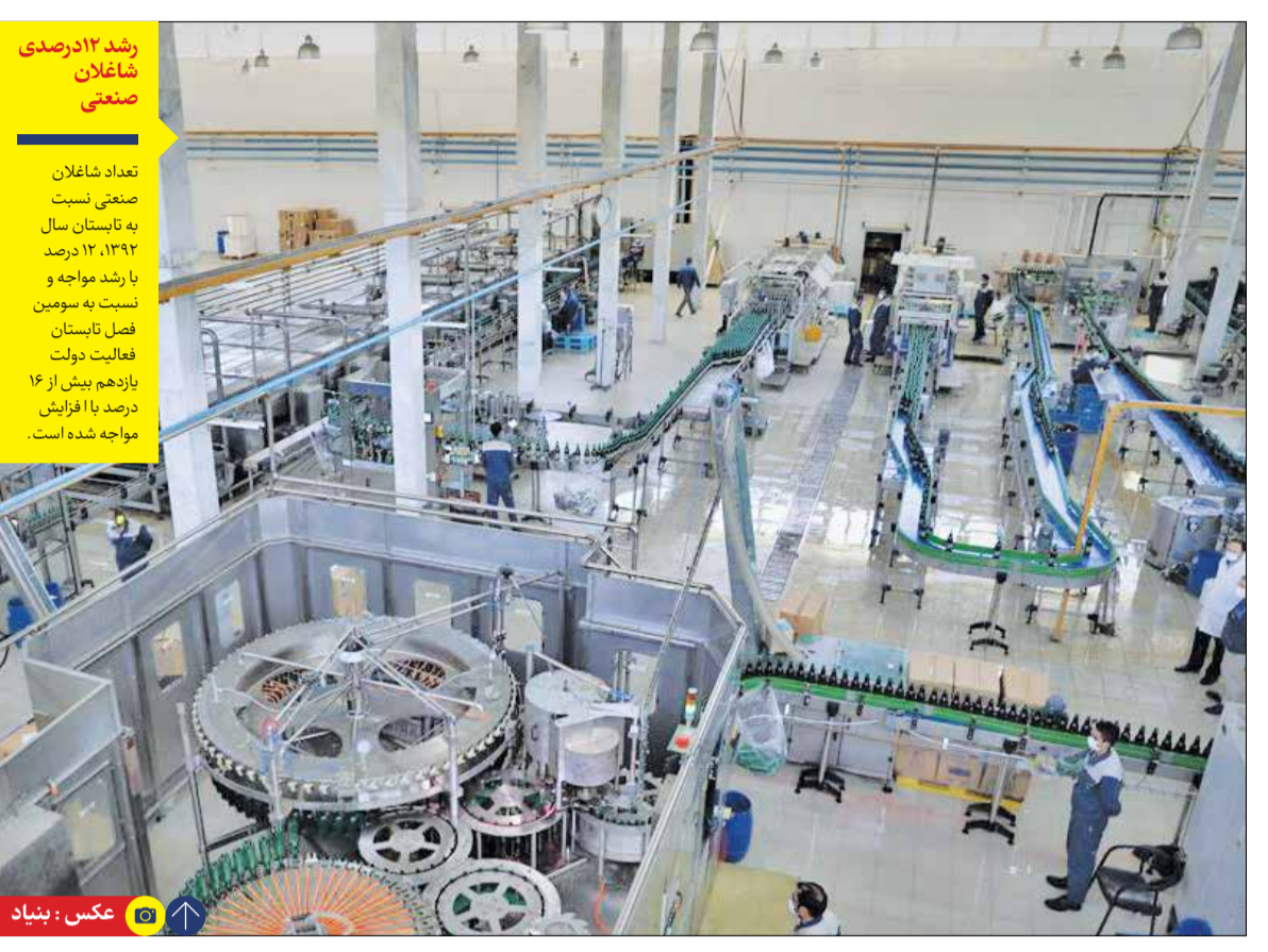
در دولت سیزدهم سهم اشتغال صنعتی همپای تولید آن افزایش یافته است

رشد ۱۲ درصدی شاغلان صنعتی تعداد شاغلان صنعتی نسبت به تابستان سال ۱۳۹۲، ۱۲ درصد با رشد مواجه و نسبت به سومین فصل تابستان فعالیت دولت یازدهم بیش از ۱۶ درصد با افزایش مواجه شده است.