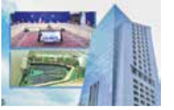
عضو هیات مدیره کانون کارگزاران مطرح کرد